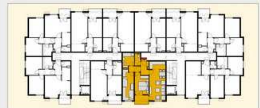
TABELA POVRSINA - STAN D4, ulaz C2, sprat P, I, II, III, IV, V, VI