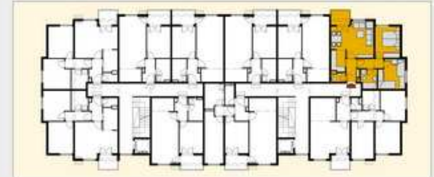
TABELA POVRSINA - STAN D3, ulaz C2, sprat P, I, II, III, IV, V, VI