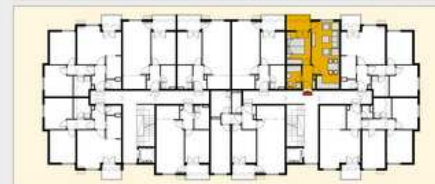
TABELA POVRSINA - STAN J5, ulaz C2, sprat P, I, II, III, IV, V, VI