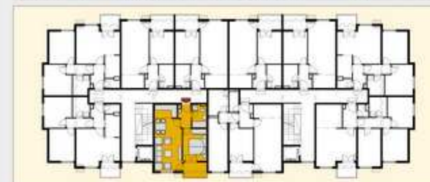
TABELA POVRSINA - STAN J3, ulaz C1, sprat P, I, II, III, IV, V, VI